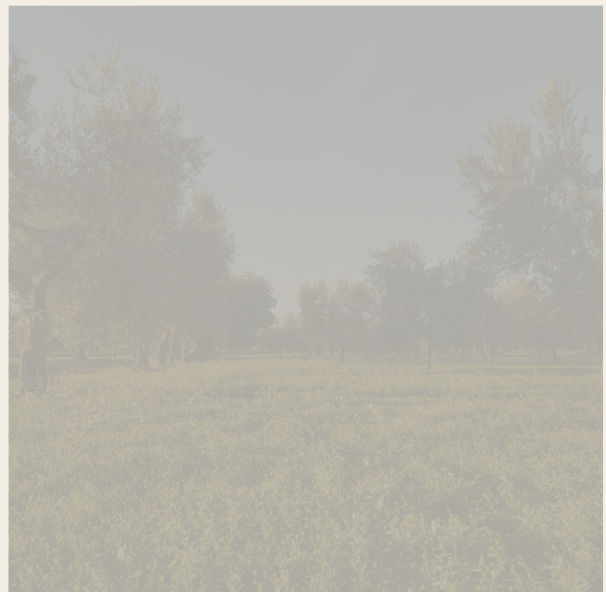
Lake terroir / Terroir di lago