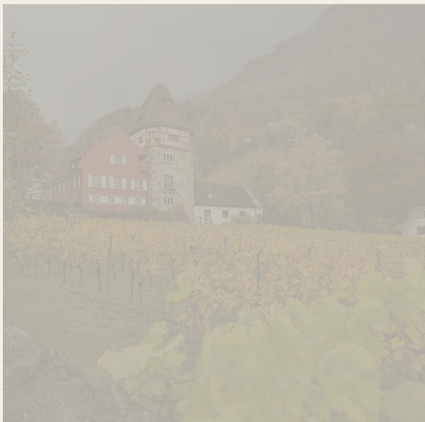
Vineyard and slope / Vigna e pendenza