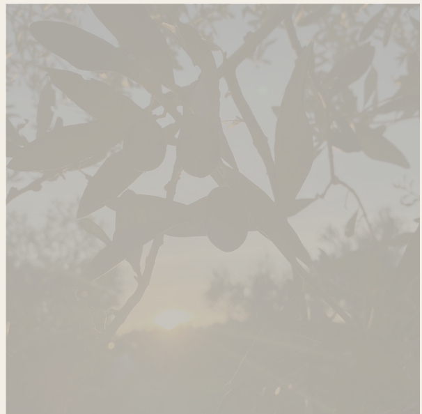
Harvest and labour / Raccolta e lavoro